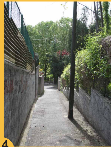
4 Les venelles. Typologie particulière des coteaux de Vitry-sur-Seine