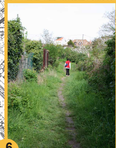
6 Ruralité. Un chemin au caractère champêtre traverse des jardins ouvriers.