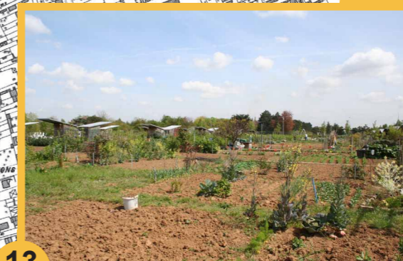
13 Les jardins ouvriers. De nouveaux jardins ouvriers sont créés dans le parc.