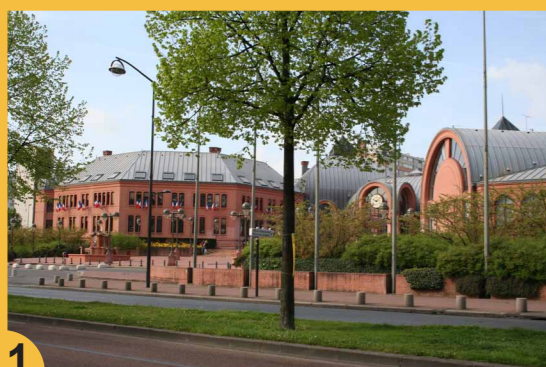
1 Hotel de ville de Vitry construit en 1985 par l'architecte François Girard.