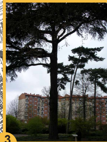
3 Le parc du Coteau. Histoire d'un parc urbain devenu public en 1975.