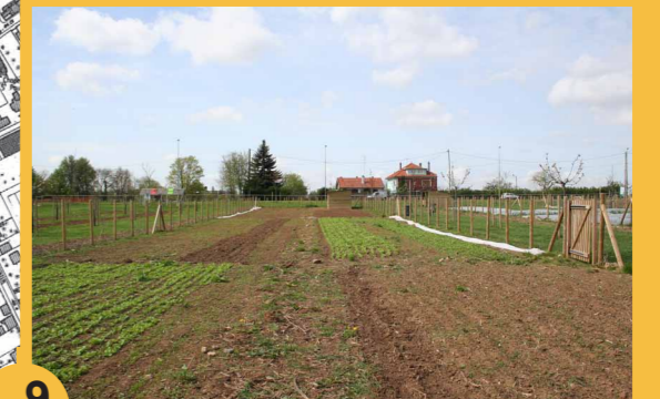
9 L'association « Planète Lilas ». Présentation de leurs activités (maraîchage, projets avec écoles...)