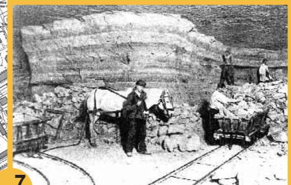
7 Le plateau. L'ancienne exploitation du site (jusqu'en 1950) a préservé le parc des constructions.