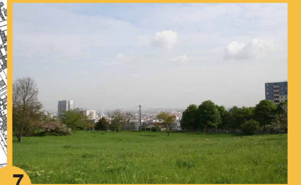
7 Le plateau. Topographie et découverte du parc des Lilas. Vues sur la ville.