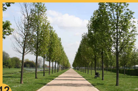
12 Le grand mail. Aménagement paysager contemporain pour le public.