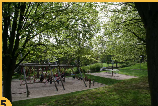
5 Espace Blondeaux. Un espace vert rattaché au parc des Lilas.